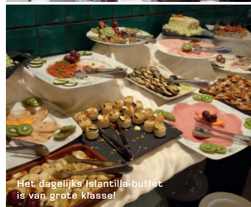
Het dagelijks Islantilla-buffet is van grote klasse!