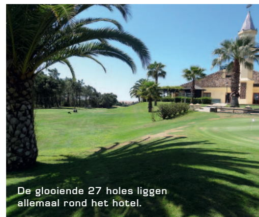
De glooiende 27 holes liggen allemaal rond het hotel.