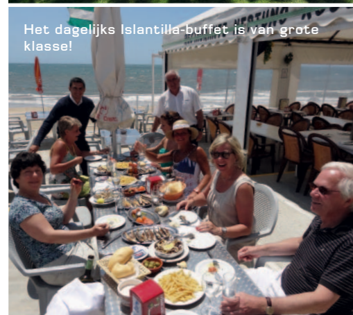
Het dagelijks Islantilla-buffet is van grote klasse!