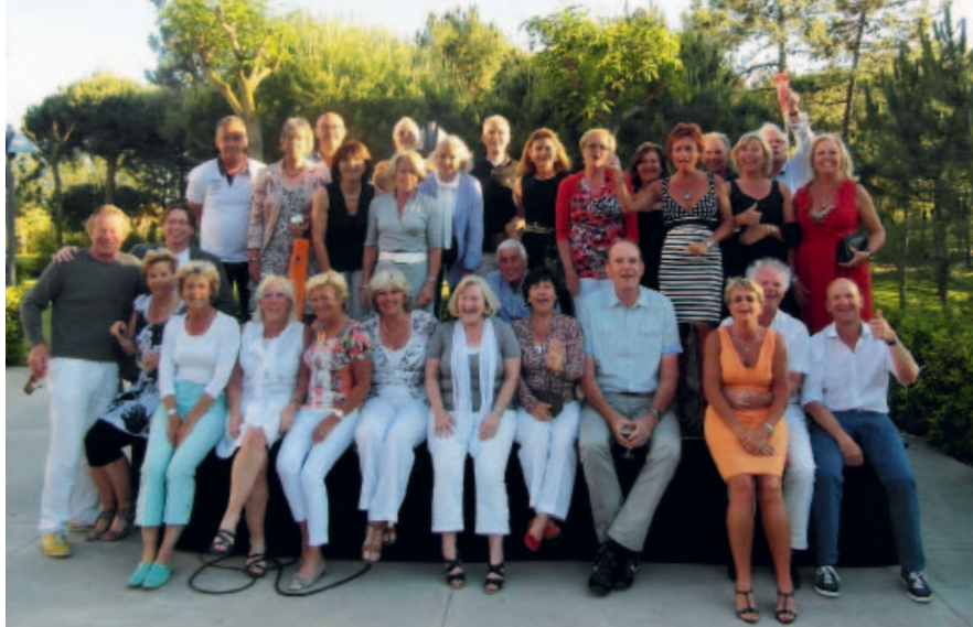
Alleengaand, ja! Maar zeker niet eenzaam. Flight4You too?

chauffeurskwaliteit kan dit uiteraard de kennismaking met uw reisgenoten verdiepen. Het aparte is wel dat bij aankomst in Faro het één uur vroeger is en het na vijftien minuten in de auto, als we over de grens zijn, alweer één uur later is. Zo slingert de jetleg zich heen en weer door mijn lichaam.