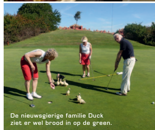
De nieuwsgierige familie Duck ziet er wel brood in op de green.